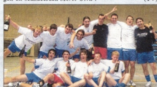
De spelers gingen na de wedstrijd uit de bol.