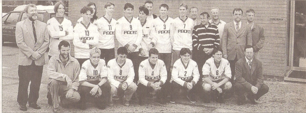
Het behalen van twee titels vond de familie Packo een goeie reden om voor de Zedelgemse volleybalclub een feestje op te zetten.

men met de spelers en met een beperkt budget, veel te realiseren, vooral naar de jeugdwerking toe. „Ik wil hier dan ook nog eens benadrukken dat ik de jongste beslissing om niet meer te spelen in 2de landelijke ten volle steun en het een zeer goede oplossing vind voor het Zedelgemse volleybal in het algemeen en voor de spelers en de jeugdspelers in het bijzonder. Twee rode draden liepen door het beleid van de club: de vriendschap en de ambiance en het werken