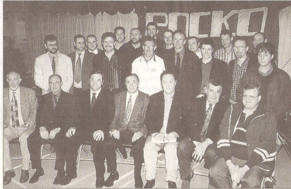
VC Packo had alle redenen om feest te vieren. De Zedelgemse volleybalfamilie bestaat immers 25 jaar.

de internationale uitstapjes. In 1975 werd het volleybalgezelschap opgewacht in het schitterende sportcentrum van het Nato hoofdkwartier in Weiden. Volleybal Packo werd een ploeg vrienden met centraal zo goed mogelijk volleybal spelen.