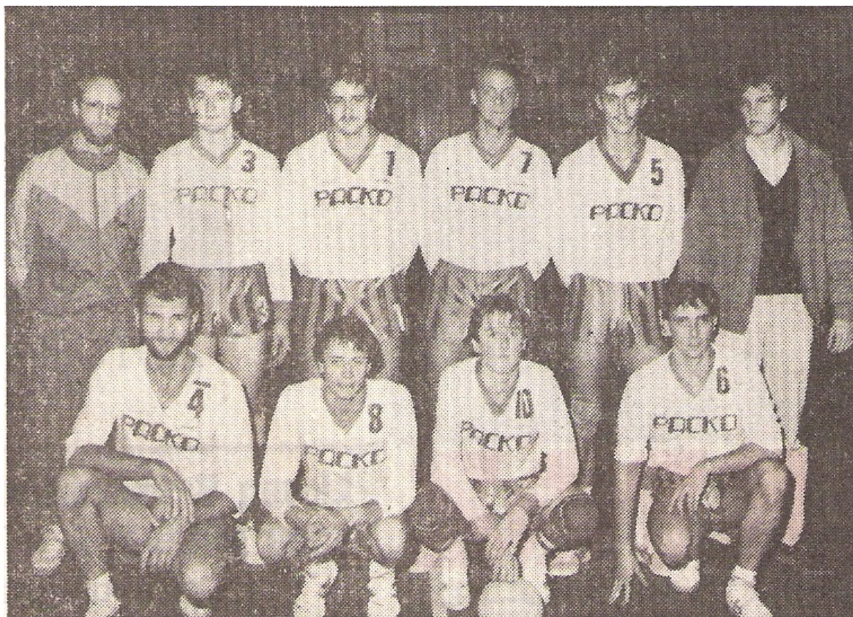
VC Packo Zelgem heren 1.

VC Packo Zedelgem haalt voor de derde maal de finale van de "Trofee Vercruysse". Helaas is het voor VC Packo Zedelgem niet 3 e keer goeie keer. De finale gaat verloren. De Zedelgemnaren gaan nipt 3-2 onderuit tegen Knack Roeselare dat uitkomt in 3 e landelijke.