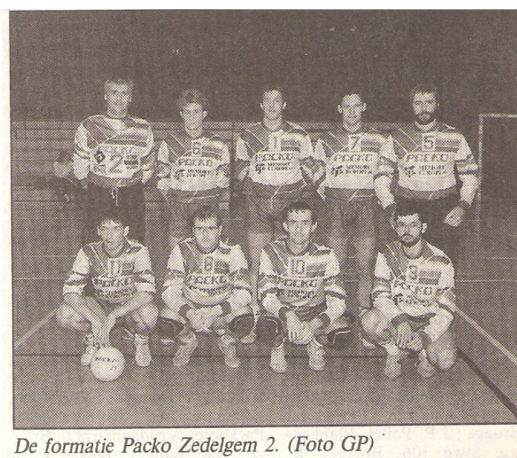
De formatie Packo Zedelgem 2.

De ploeg die vorig jaar zakte naar 1 e provinciale, speelt krampachtig en kan zich uiteindelijk nipt redden.