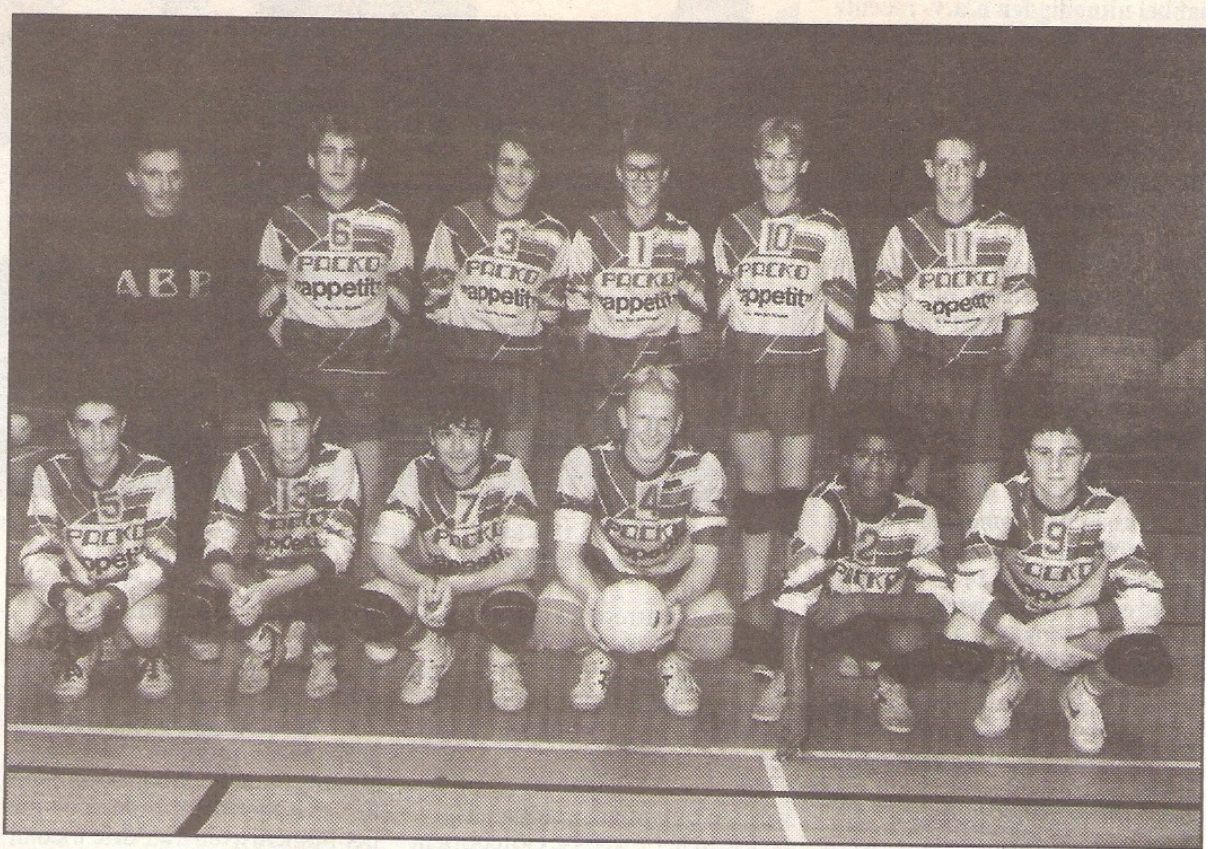
Packo Zedelgem 3, aantredend in 3e provinciale afdeling heren.

De ploeg in 2 e provinciale werd opgedoekt. De overgebleven spelers worden verdeeld onder de ploeg in 1 e provinciale (zie foto boven) en de ploeg die uitkomt in 3 e provinciale (zie foto onder).