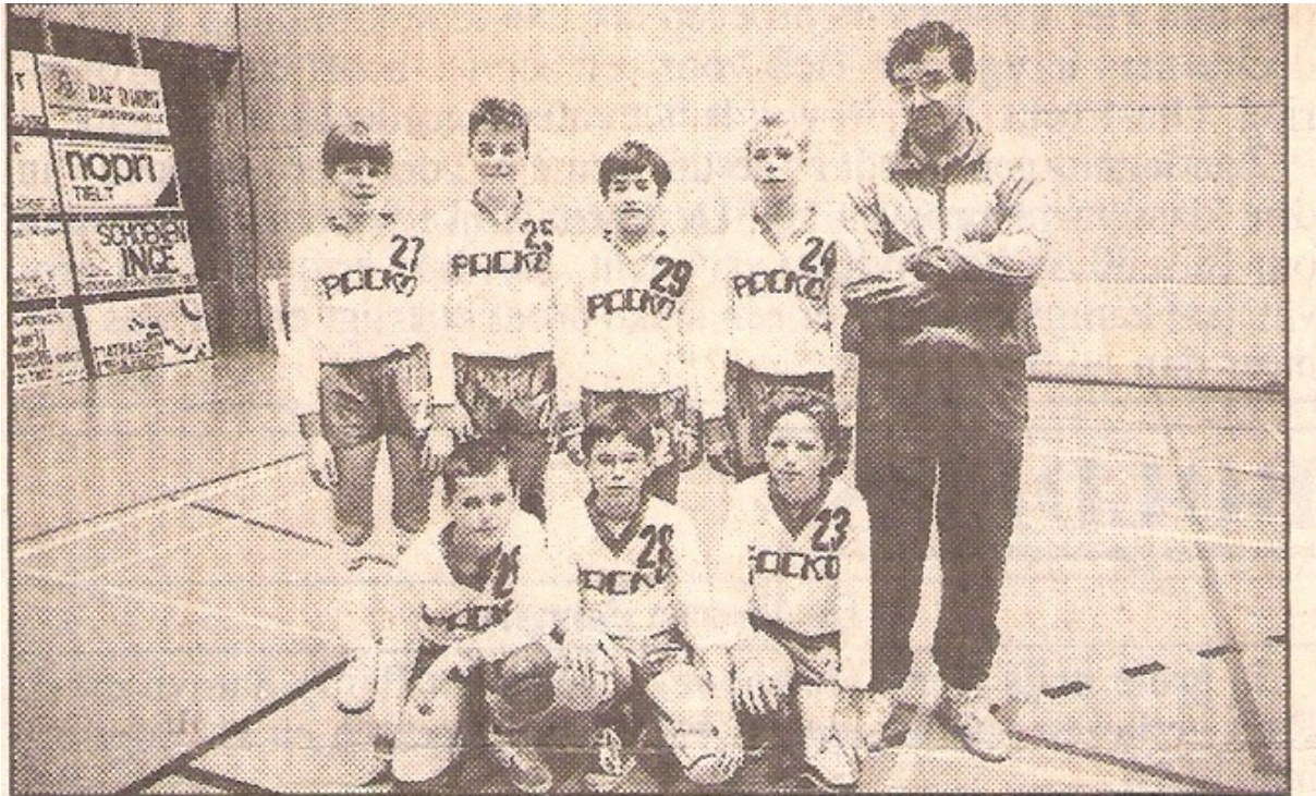
Packo Zedelgem won bij de miniemen jongens met 1-3 van Knack Roeselare.

De D-jeugd behaalt enkele mooie resultaten, maar missen een constante om de titel te behalen.