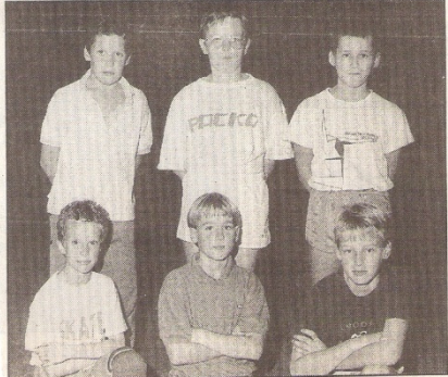
De jongens die bij Packo Zedelgem worden ingezet bij de D-jeugd jongens regionaal B.