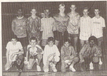
Zo te zien heeft VK Packo Zedelgem ook geen gebrek aan B-spelers (scholieren).