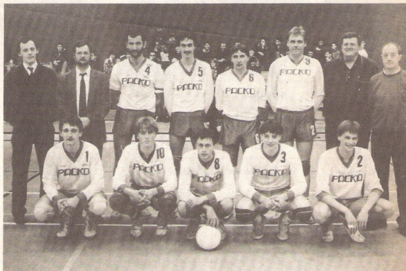
Het inpassen van jongeren verloopt vlotter dan verwacht bij Packo dat in de aparte wedstrijden zoals tegen toppers en in derby's zijn vroegere positieve agressiviteit teruggevonden heeft. En de succesvolle jeugdwerking is er een wissel op de toekomst. G.T.

ten”, gaat Hugo Van Riet verder. „Heel wat meer supporters vinden de weg weer naar de sporthal. De leken in de volleybalsport leren via die vrijkaarten meteen het volleybal kennen. En waar er verleden jaar hoogstens een dertigtal getrouwen de wedstrijden volgde, zit de tribune bij de thuiswedstrijden weer stampvol. Dat allemaal maakt dat de ambiance en samenhang weer heel groot zijn. En zelfs een eventuele degradatie zou daar niet eens veel aan veranderen. De sportieve resultaten zijn dit jaar inderdaad ondergeschikt aan de heropbouw van de ploeg”, besluit Hugo Van Riet. B.M.