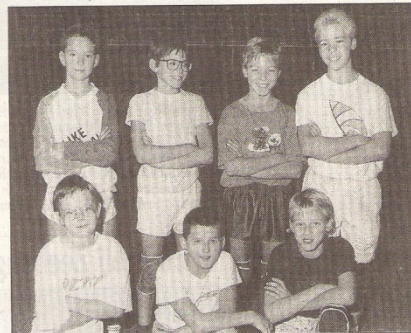
De Packo Zedelgem beschikt ook over niet minder dan 4 ploegen E-jeugd jongens. Hier een van de 2 Zedelgense préminiem-teams.